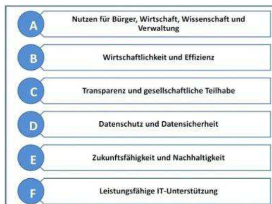
Abbildung 1: Zielsystem der NGIS

Mit der NGIS soll darüber hinaus ein gemeinsames Grundverständnis über strategische Ziele erreicht und die Wahrnehmung der eigenen fachlichen Aufgaben transparent dargestellt werden. Die Ziele der NGIS gliedern sich in sechs Zielbereiche mit insgesamt 15 Zielen und 47 Unterzielen. Sie stellen den angestrebten Zustand, mithin eine Vision bis zum Jahr 2025, im Bereich der Geoinformationen in Deutschland dar.