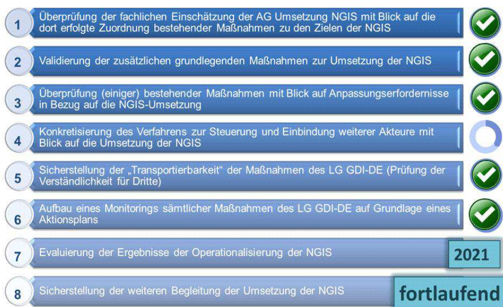
Abbildung 3: Handlungsempfehlungen an das Lenkungsgremium GDI-DE (Stand Dezember 2020)

Zur Unterstützung des Lenkungsgremiums GDI-DE bei der Koordinierung und Umsetzung der NGIS wurde im März 2016 die Arbeitsgruppe Umsetzung NGIS eingerichtet, um die nachhaltige Realisierung und Evaluierung der NGIS seitens des Lenkungsgremiums GDI-DE sicherzustellen. An die Arbeitsgruppe erging zunächst der Auftrag, ein Konzept zur Operationalisierung der NGIS zu entwickeln, welches 2017 fertiggestellt und vom Lenkungsgremium GDI-DE beschlossen wurde. In dem Konzept sind Maßnahmen herausgearbeitet worden, die für die konkrete Zielerreichung von grundlegender Bedeutung sind. Es zeigte sich, dass in den meisten Fällen bereits eine geringfügige Anpassung an den vorhandenen Maßnahmen zur Beförderung der NGIS-Ziele beiträgt. Darüber hinaus wurden für das Lenkungsgremium GDI-DE weitere Handlungsempfehlungen definiert, um eine weitreichende und nachhaltige Umsetzung der NGIS zu gewährleisten. Die Steuerung und Koordination der Umsetzung dieser Handlungsempfehlungen erfolgt durch die Arbeitsgruppe Umsetzung NGIS.