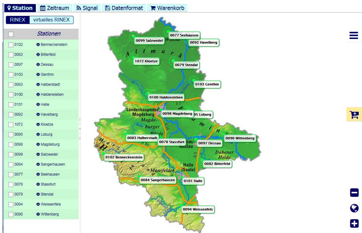
Abbildung 1 Startfenster zur Auswahl der Referenzstationen

Sollte das Startfenster nach erfolgreicher Anmeldung nicht erscheinen, ist im Browser möglicherweise Java nicht aktiviert.