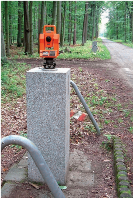
Kalibrierstrecke Golmenglin

Vermessungsinstrumente und -geräte unterliegen einem natürlichen Veränderungsprozess. Daraus ergibt sich die zwingende Notwendigkeit, die geodätischen Messinstrumente und -systeme in angemessenen Abständen zu kalibrieren. Nur so kann sichergestellt werden, dass mit den verwendeten Instrumenten und Systemen die Genauigkeitsvorgaben für das amtliche Vermessungswesen erreicht werden.